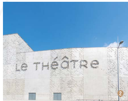
1/ GARE SNCF DE SAINT-NAZAIRE 2/ LE THÉÂTRE

Et, pour mieux profiter de la trame cyclable qui passe à proximité, irriguant l'ensemble de Saint-Nazaire et de Pornichet, des vélos électriques et vélos cargos sont à la disposition des résidents.