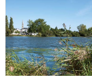
1/ LES MARAIS DE LA BRIÈRE 2/ PORT MARITIME 3/ VUE AÉRIENNE DE SAINT-NAZAIRE

Parce qu'au-delà de son économie florissante, entre construction navale, aéronautique, mécanique mais aussi informatique, Saint-Nazaire est reconnue pour sa qualité de vie . Ville maritime offrant de nombreuses plages, ville culturelle rythmée par les festivals et événements, Saint-Nazaire est vivante et animée toute l'année . Si la mer est à ses pieds, la nature est à ses portes, avec notamment le parc naturel de Brière. En pleine forme et en plein essor, ce n'est pas un hasard si Saint-Nazaire figure toujours en bonne place dans les palmarès des villes où il fait bon vivre et travailler .