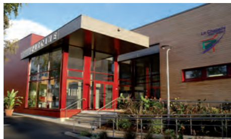
Piscine, rue de Monteloup

À seulement 5 kilomètres* à l'ouest d'Orléans, La Chapelle-Saint-Mesmin fait partie du Val de Loire, site inscrit au patrimoine mondial de l'Unesco. De son histoire millénaire, la ville a hérité de monuments prestigieux, dont le château de l'Ardoise, le château des Hauts ou encore l'église de la Chapelle-Saint-Mesmin, l'une des plus anciennes de la région.