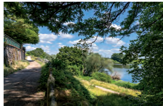
Chemin du bord de Loire