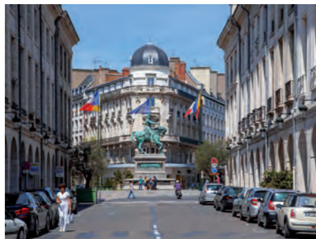
Rue Royale & place du Martroi à Orléans