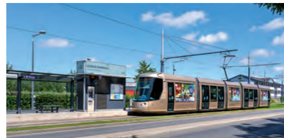
Station de tramway Georges Pompidou