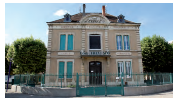
Groupe scolaire Thévenon