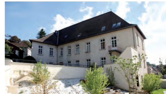
Centre-ville de La Tour du Pin

Pour se déplacer facilement, un minibus parcourt la ville et dessert notamment le marché, organisé trois fois par semaine.