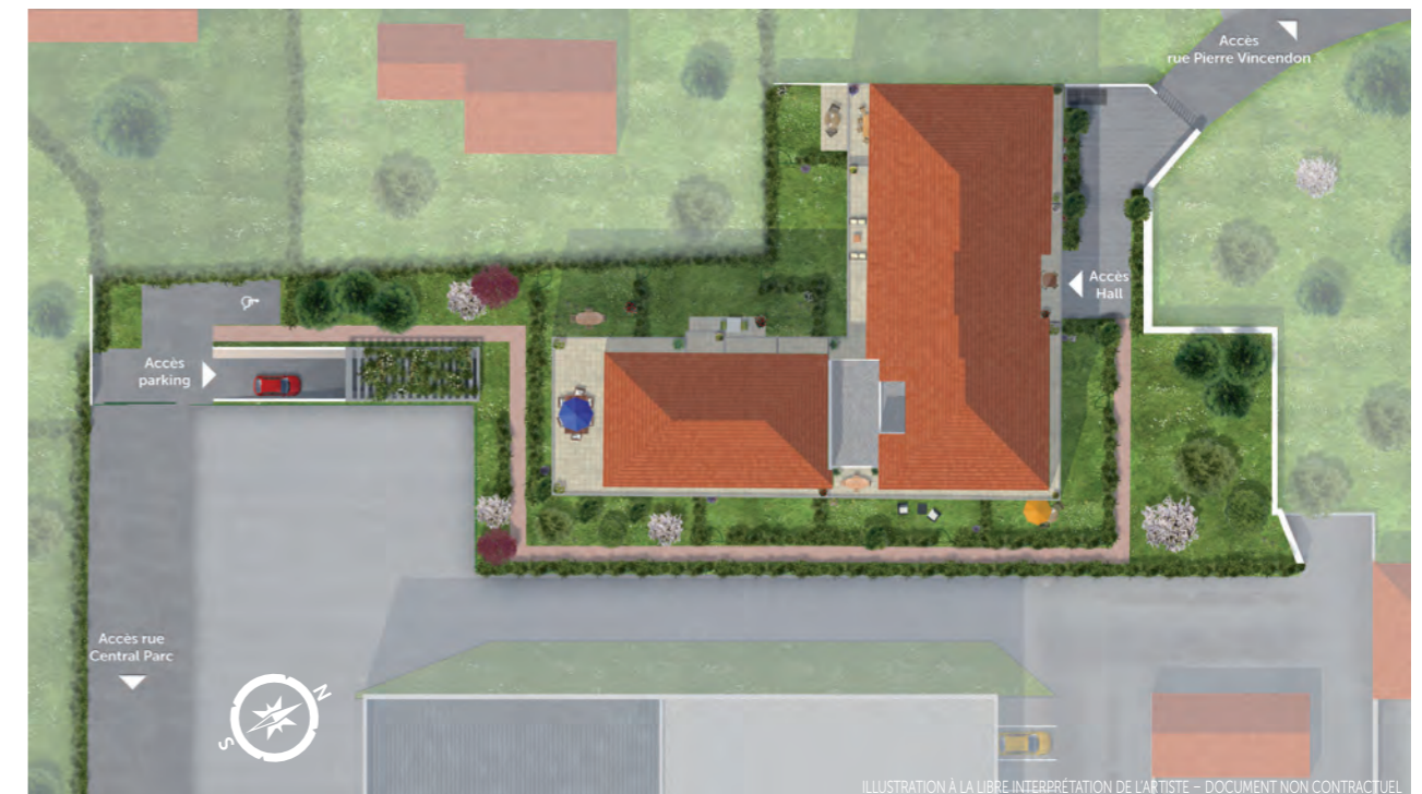
ILLUSTRATION À LA LIBRE INTERPRÉTATION DE L'ARTISTE - DOCUMENT NON CONTRACTUEL