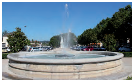
Fontaine du champs de Mars