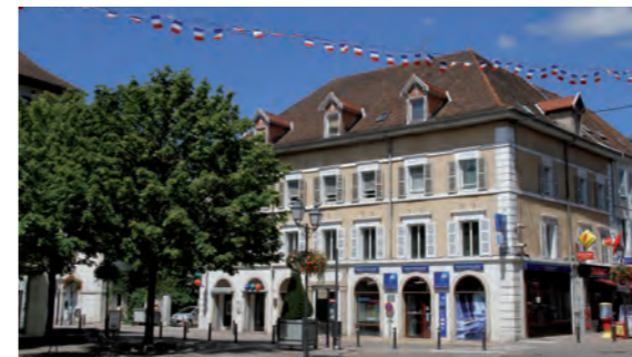
Places Antonin Dubost