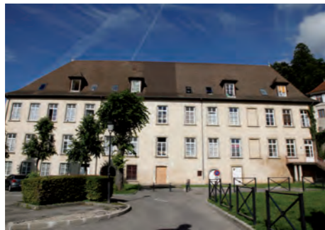
Maison de La Nation