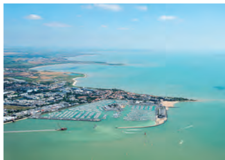
Port et plage des Minimes