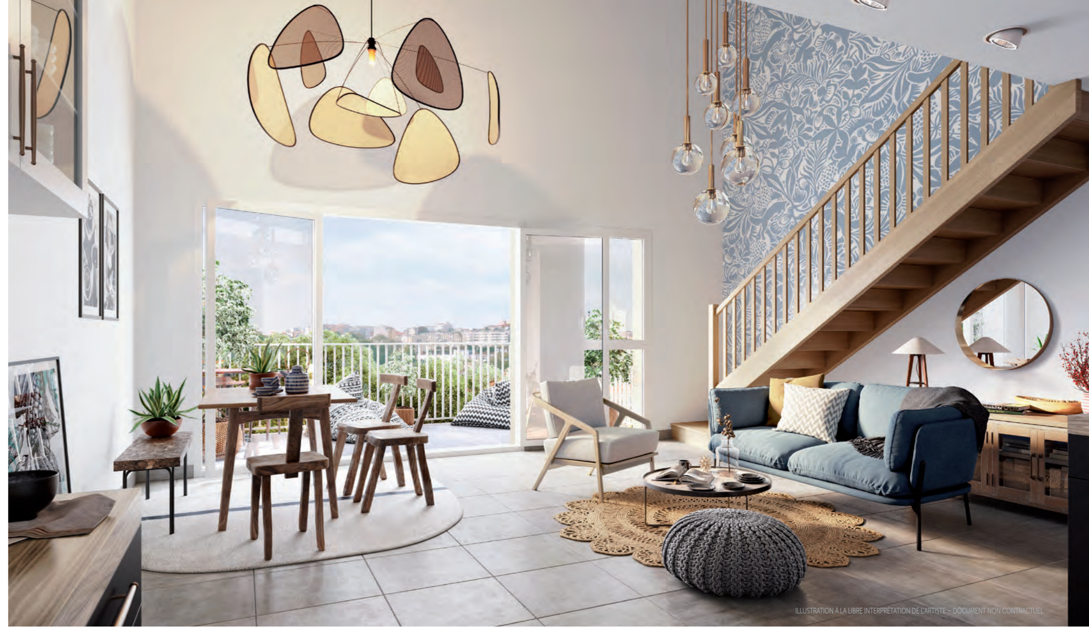
ILLUSTRATION À LA LIBRE INTERPRÉTATION DE L'ARTISTE - DOCUMENT NON CONTRACTUEL