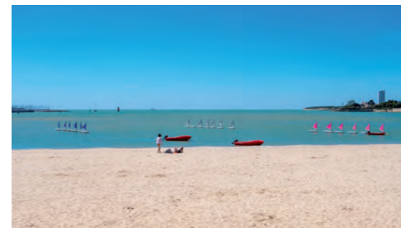
Plage de la Concurrence

La Rochelle se distingue également par son engagement pour l'environnement. Pionnière en matière d'écologie urbaine depuis plus de 40 ans, elle fut la première à installer vélos et voitures électriques en libre-service. Elle compte également des bateaux électriques publics et des bus fonctionnant au biogazole. Une démarche exemplaire saluée et récompensée.