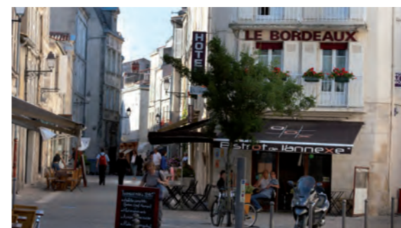
Rue piétonne Saint-Nicolas