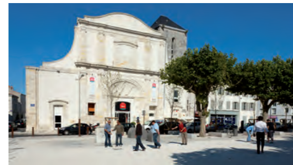
Hôtel Ibis, au cœur du centre historique