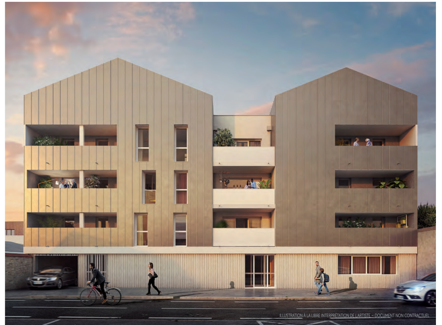
ILLUSTRATION À LA LIBRE INTERPRÉTATION DE L'ARTISTE - DOCUMENT NON CONTRACTUEL

Éklo présente une architecture contemporaine sobre et moderne. Elle se distingue par deux volumes séparés d'un retrait central accueillant des loggias. Cette composition est accentuée par le jeu de contraste entre l'enduit blanc et le parement de métal gris. Les toitures à deux pans concluent les façades et s'inspirent des maisons présentes au sein du quartier.