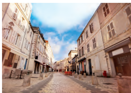
Rue Saint-Jean du Pérôt

Cité millénaire riche d'histoire et de patrimoine, La Rochelle s'étend face à l'océan Atlantique. Cet ancrage maritime unique lui assure un complexe portuaire de premier ordre incluant trois ports : de commerce, de pêche et de plaisance. Elle s'est ainsi imposée comme la ville côtière la plus importante entre l'estuaire de la Loire et l'estuaire de la Gironde. Son rayonnement économique, touristique et culturel est remarquable.