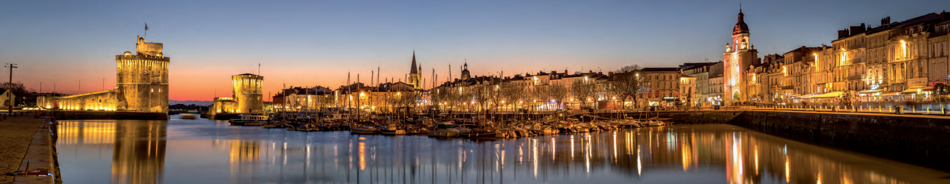
Vue panoramique du vieux port de La Rochelle