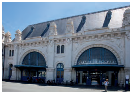
Gare de La Rochelle