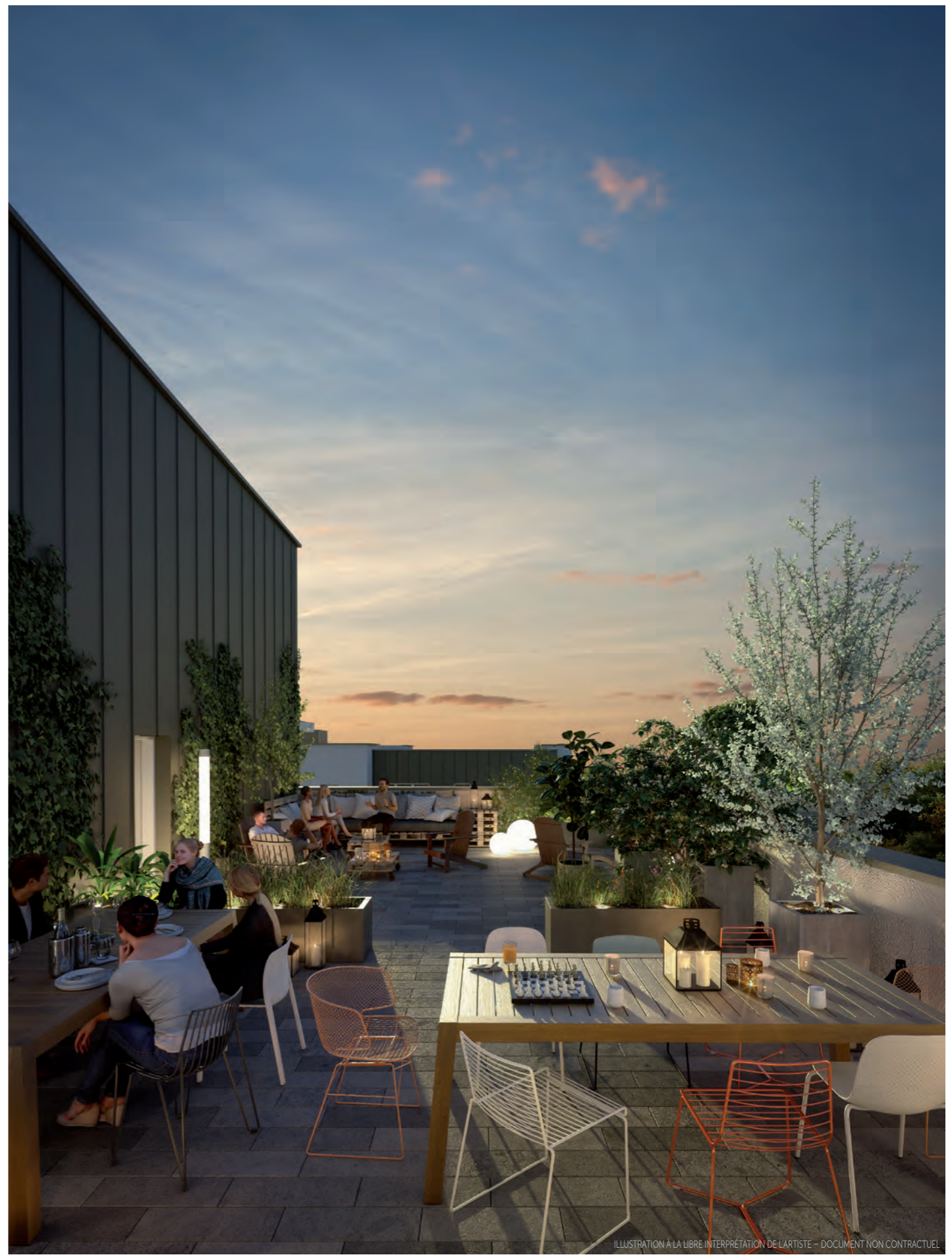
ILLUSTRATION À LA LIBRE INTERPRÉTATION DE L'ARTISTE - DOCUMENT NON CONTRACTUEL