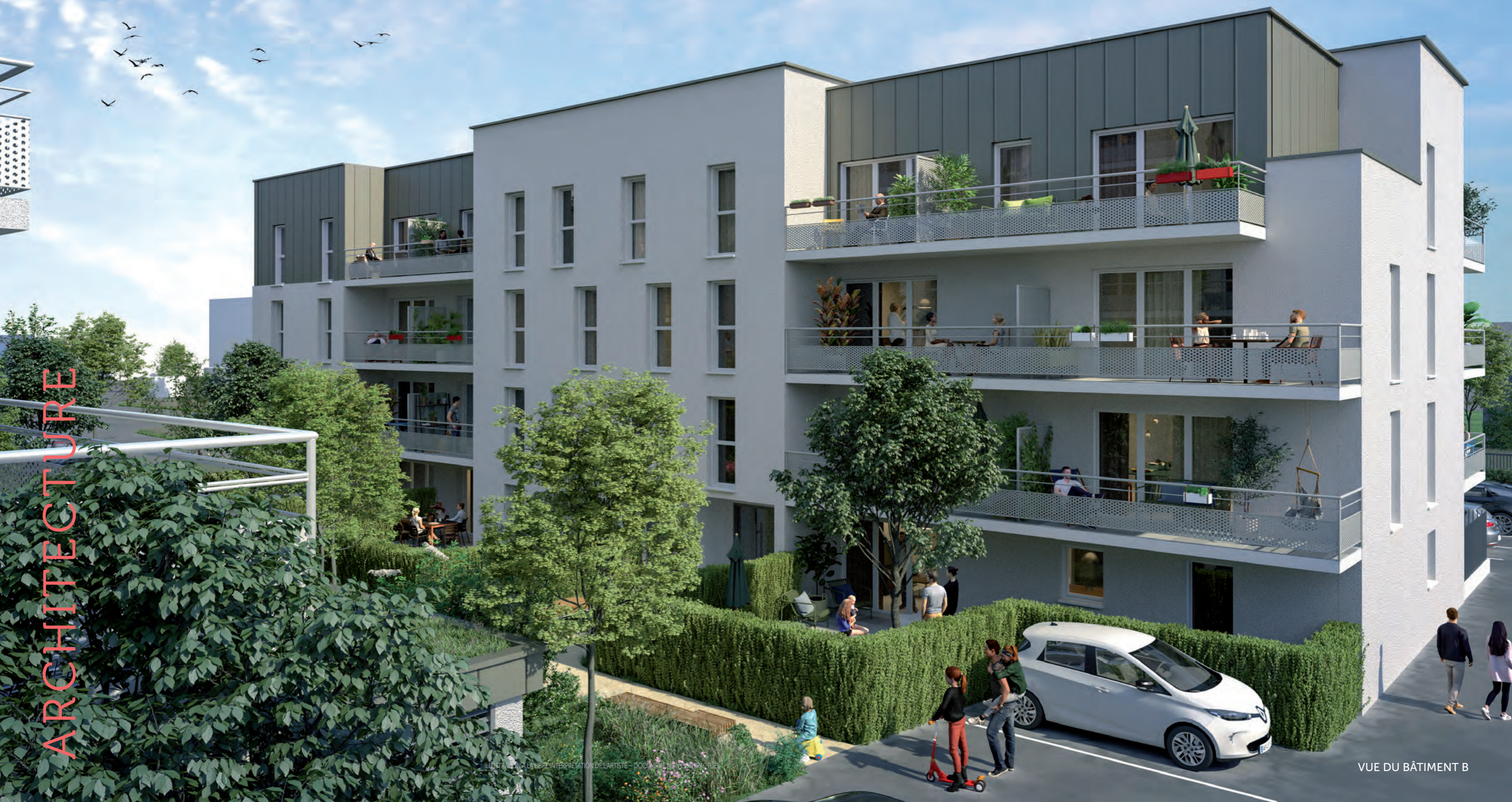
ILLUSTRATION À LIBRE INTERPRÉTATION DE L'ARTISTE - DOCUMENT NON CONTRACTUEL