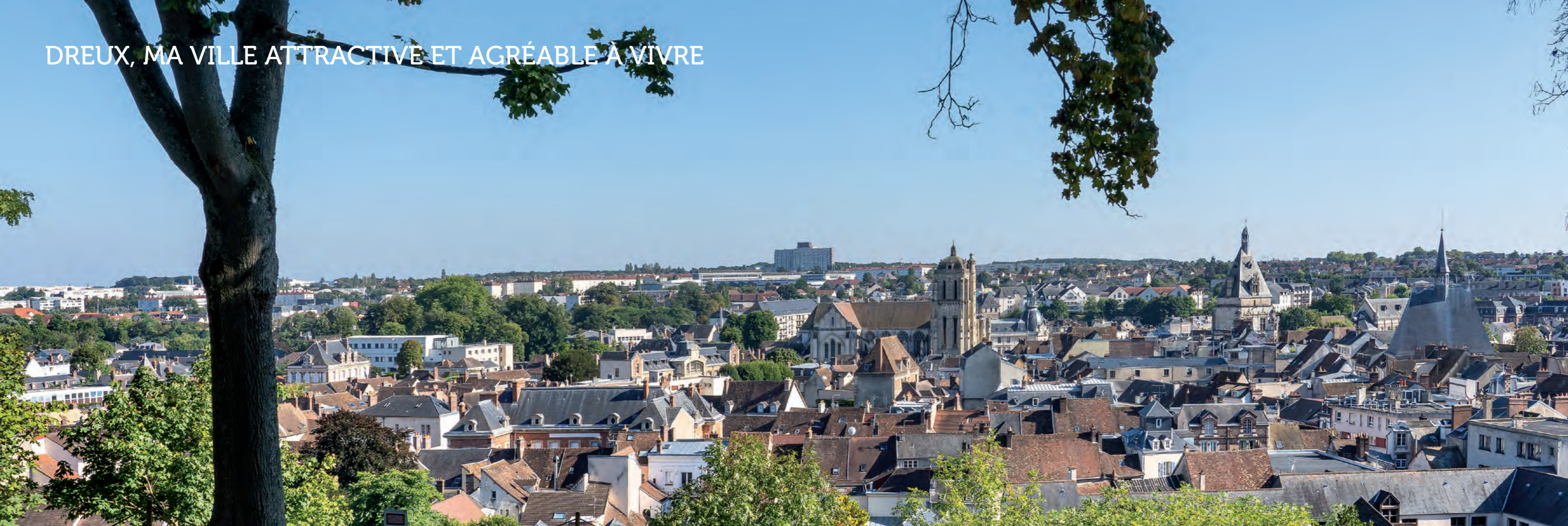
Vue panoramique de la ville de Dreux