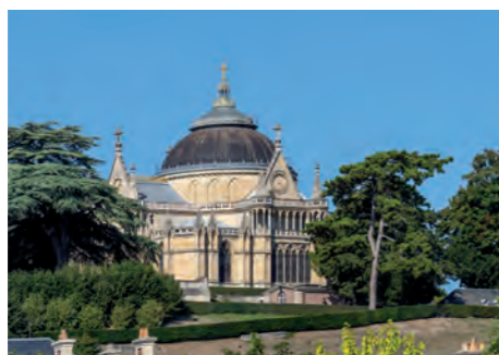
Domaine de la Chapelle Royale

Aux portes de la région parisienne, Dreux est riche d'histoire. Le cœur de ville abrite la Chapelle Royale Saint-Louis, le beffroi et d'élégantes maisons anciennes à pans de bois... autant de trésors du patrimoine qui témoignent de la prospérité de la ville au fil des siècles.