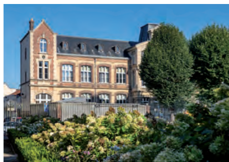
École Rue Godeau

Aux portes de la région parisienne, Dreux est riche d'histoire. Le cœur de ville abrite la Chapelle Royale Saint-Louis, le beffroi et d'élégantes maisons anciennes à pans de bois... autant de trésors du patrimoine qui témoignent de la prospérité de la ville au fil des siècles.