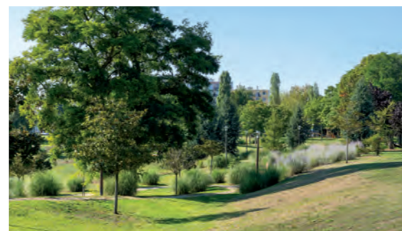
Parc de la Sablonnière