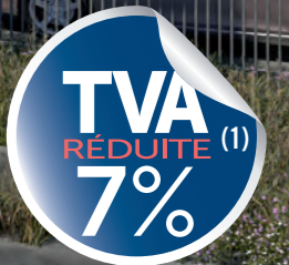
ILLUSTRATION À CARACTÈRE INTERPRÉTATION DE L'ARTISTE - DOCUMENT NON CONTRACTUEL

MySquare est composé de 56 appartements déclinés du studio au 4 pièces et répartis sur deux bâtiments indépendants, clos et sécurisés. Ils adoptent un style contemporain en harmonie avec l'esprit architectural du quartier du Square. La réalisation présente ainsi des volumes simples et lisibles. Les balcons et les loggias viennent rythmer les façades avec élégance et équilibre. L'enduit matricé en soubassement, l'enduit blanc du corps du bâtiment et la teinte grise plus soutenue des attiques sont parfaitement associés.