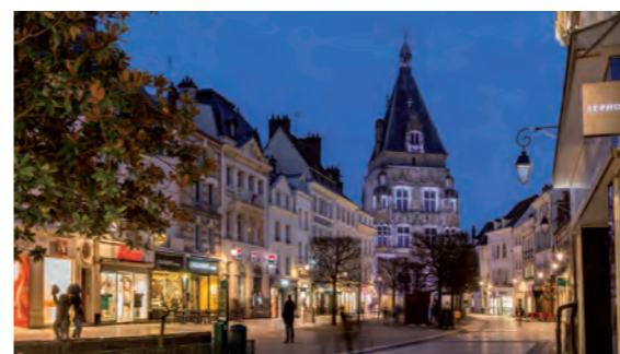
Grande Rue Maurice Viollette

Au cœur de ce lieu de vie, un hectare est dédié aux espaces verts et aux cheminements piétons, créant un véritable îlot de fraîcheur en ville. En plus de ce cadre agréable, MySquare est situé à proximité de commerces dont une boulangerie, une boucherie et trois supermarchés. La gare de Dreux et l'animation du centre historique sont accessibles à seulement 3 minutes* en voiture.