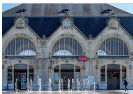
Gare de Dreux

La ville est enfin bien desservie par le TER, permettant de rejoindre la capitale en 1h10*.