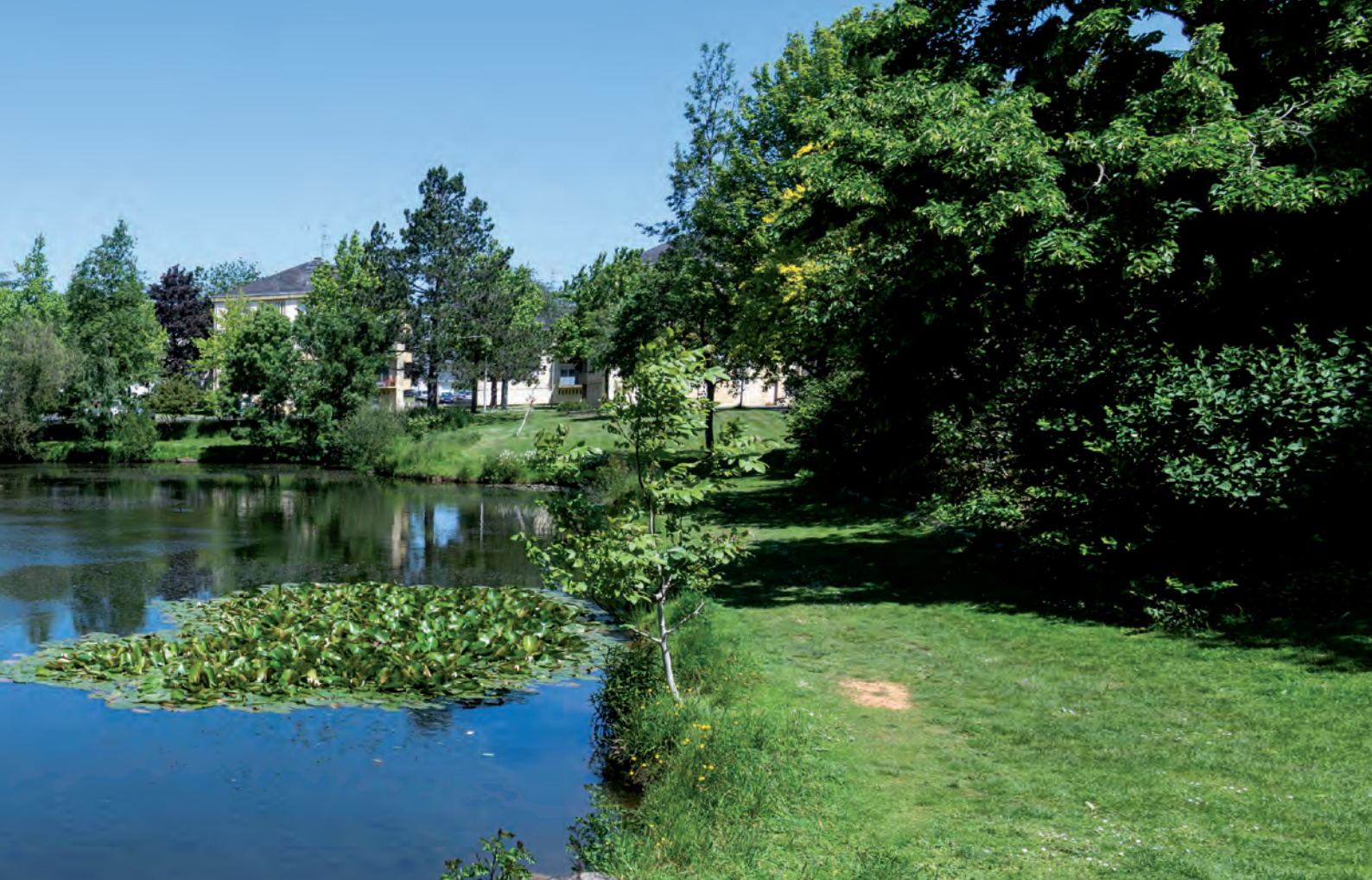
Parc Verdun (1,5 hectare)