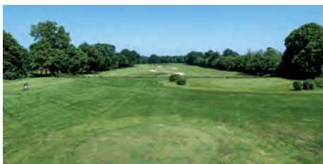
Golf, domaine de la Perrière