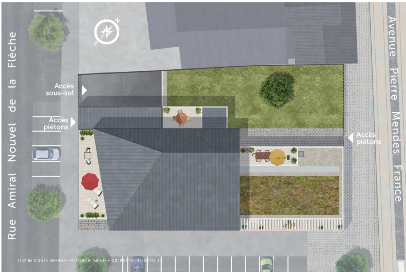
ILLUSTRATION À LA LIBRE INTERPRÉTATION DE L'ARTISTE - DOCUMENT NON CONTRACTUEL