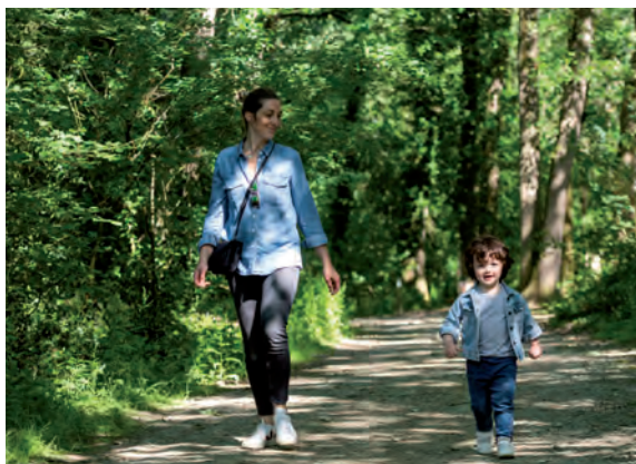
Parc des Poumons Verts