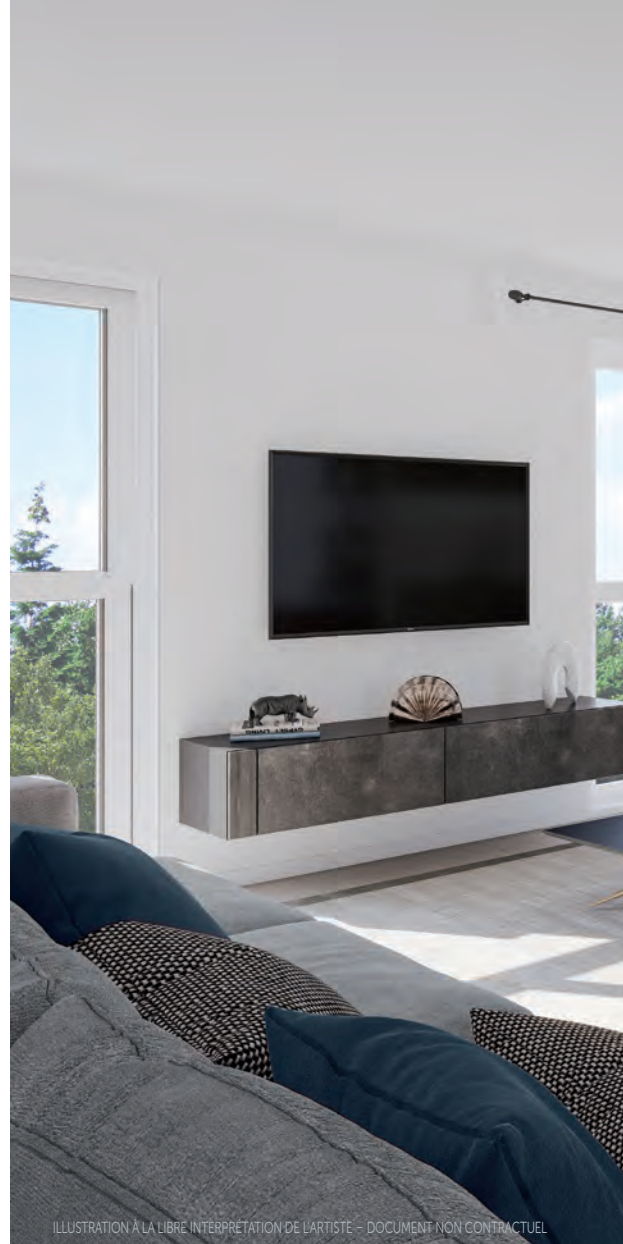
ILLUSTRATION À LA LIBRE INTERPRÉTATION DE L'ARTISTE - DOCUMENT NON CONTRACTUEL