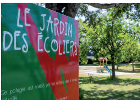
Potager réalisé par les enfants des 6 écoles d'Avrillé