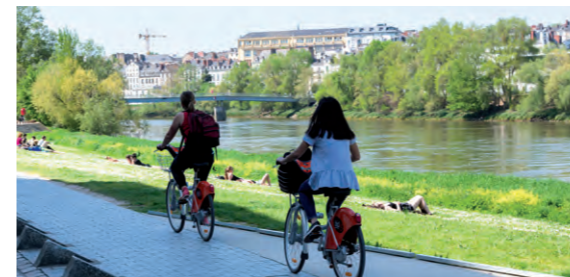
Les bords de l'Erdre