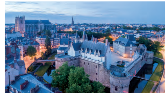
Château des Ducs de Bretagne

Nantes s'impose enfin comme un pôle économique et universitaire d'envergure. Connectée aux principales villes françaises et européennes grâce à son aéroport, à moins de 2 heures de Paris par le TGV et à 45 minutes* en voiture de la façade Atlantique, elle offre un territoire attractif où il fait bon vivre, travailler et étudier.