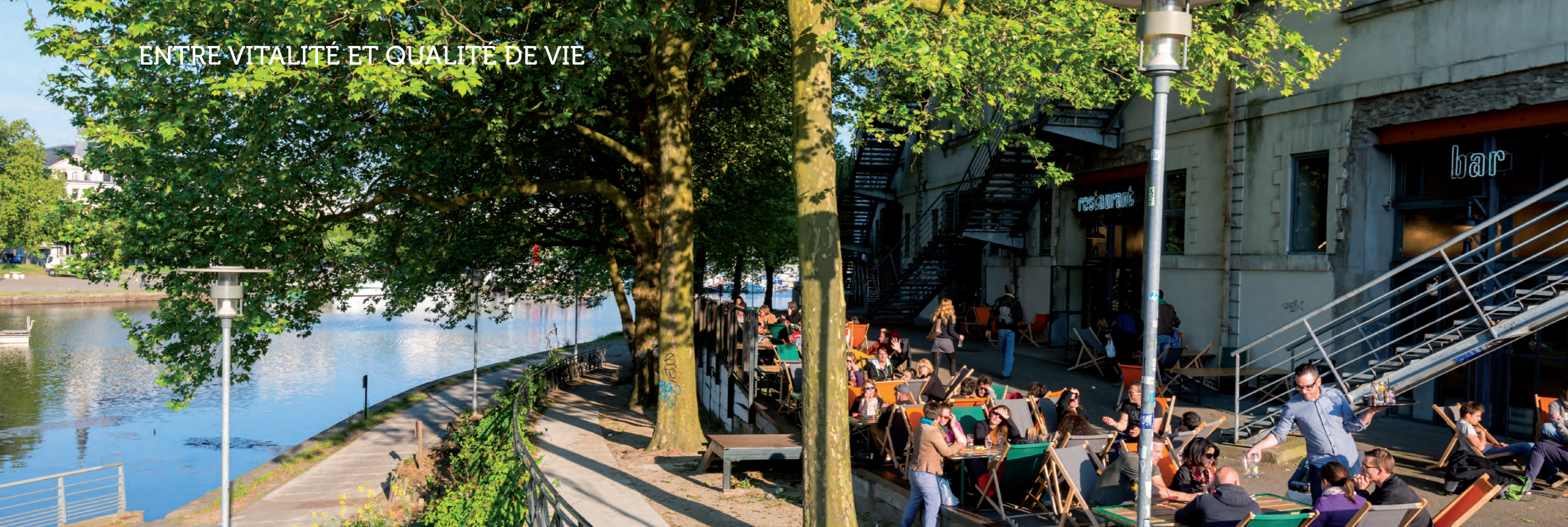
Lieu unique, centre de culture contemporaine, installé dans les anciens locaux de la biscuiterie LU