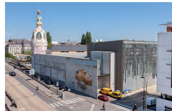
Le Lieu Unique