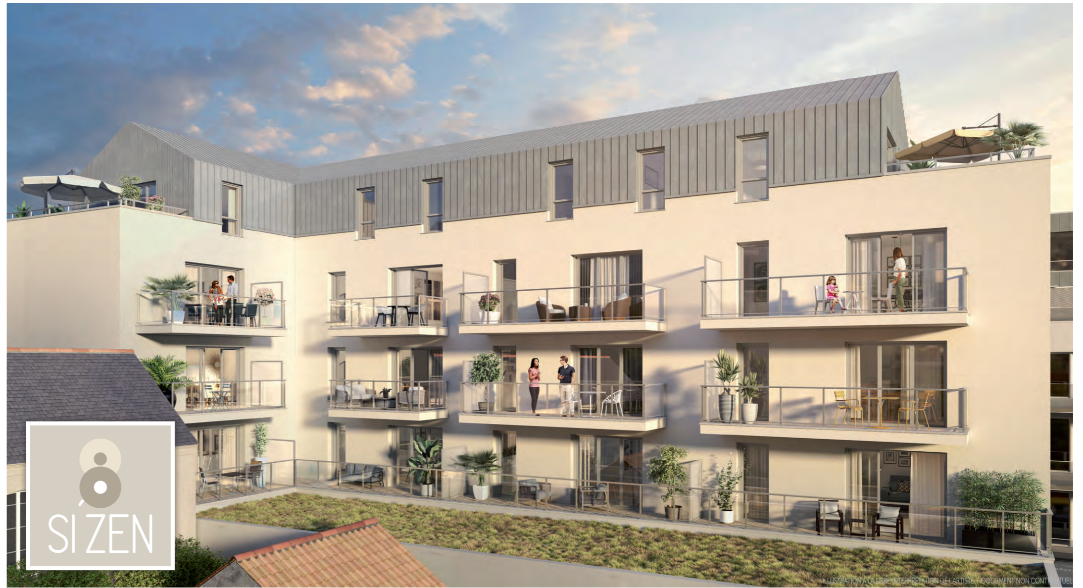
ILLUSTRATION À LA LIBRE INTERPRÉTATION DE L'ARTISTE - DOCUMENT NON CONTRACTUEL