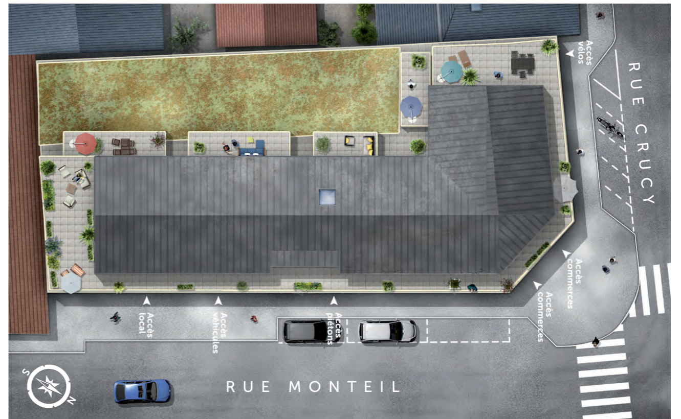
ILLUSTRATION À LA LIBRE INTERPRÉTATION DE L'ARTISTE - DOCUMENT NON CONTRACTUEL