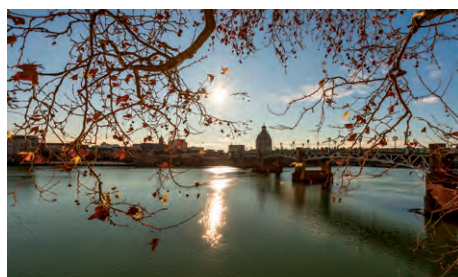
Pont Saint-Pierre et la Garonne à Toulouse

Aux portes du Lauragais, Escalquens s'étend dans un vaste massif de collines. Traversée par le ruisseau du Berjean, cette charmante ville pavillonnaire séduit par son cadre champêtre où il fait bon vivre.