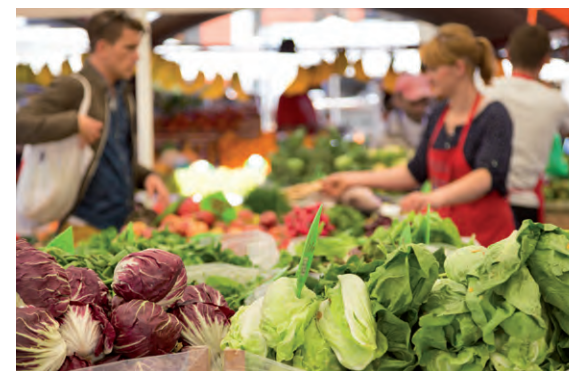
Marché, commerces de proximité