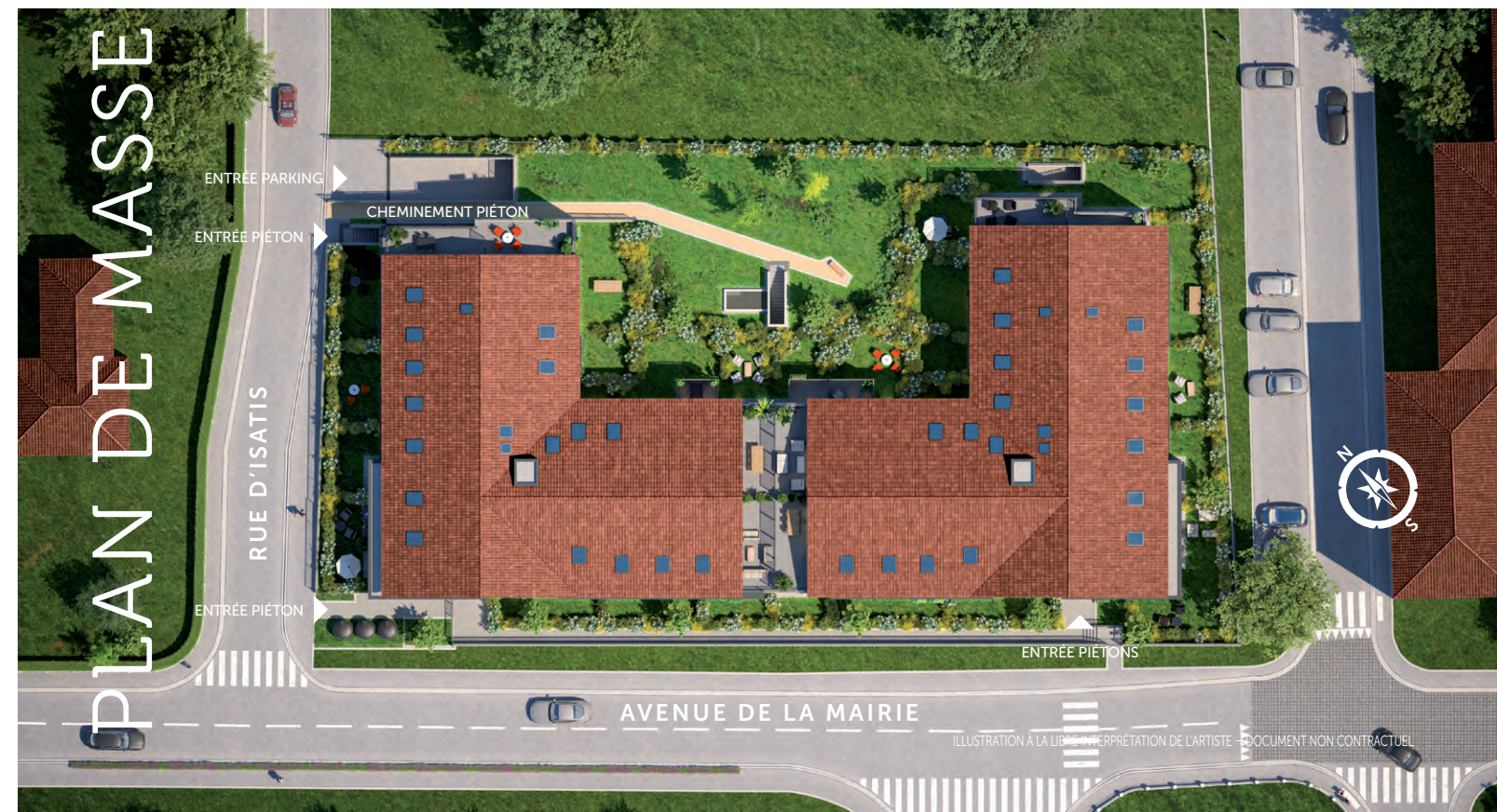
ILLUSTRATION À LA LIBRE INTERPRÉTATION DE L'ARTISTE - DOCUMENT NON CONTRACTUEL