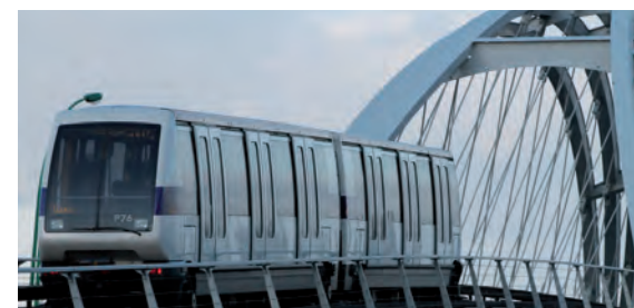
Le métro Toulousain