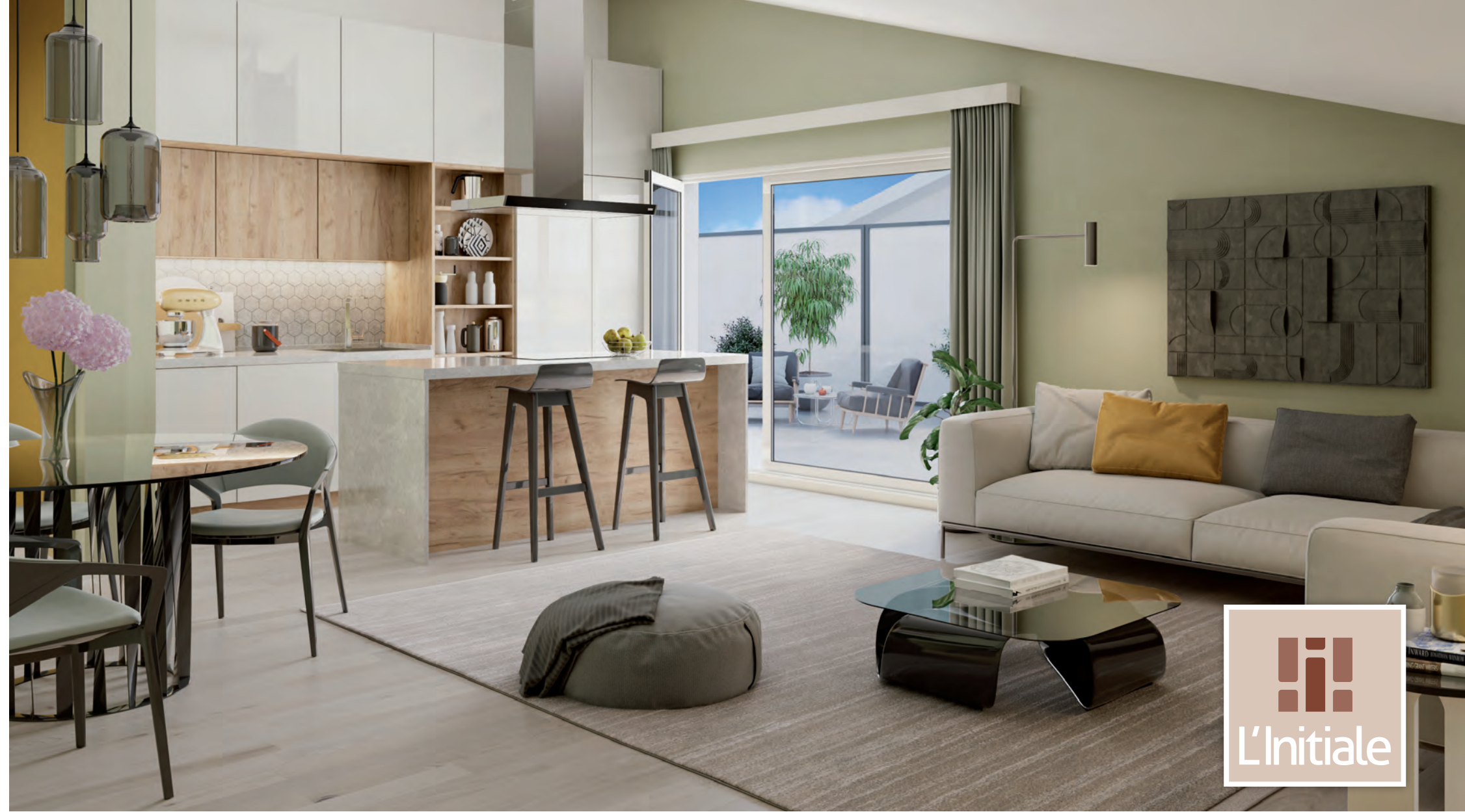
ILLUSTRATION À LA LIBRE INTERPRÉTATION DE L'ARTISTE - DOCUMENT NON CONTRACTUEL