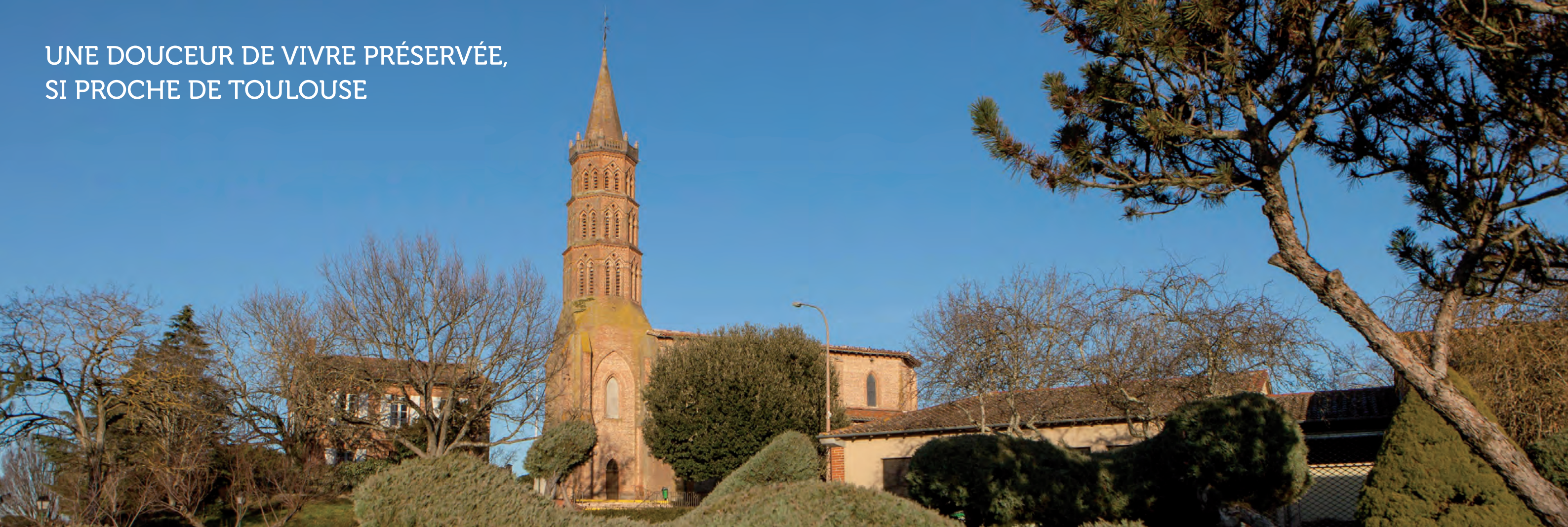
Le centre historique, l'église Saint-Martin