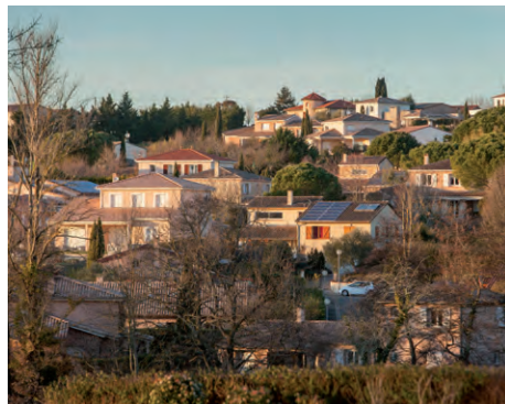
Les hauteurs de la ville