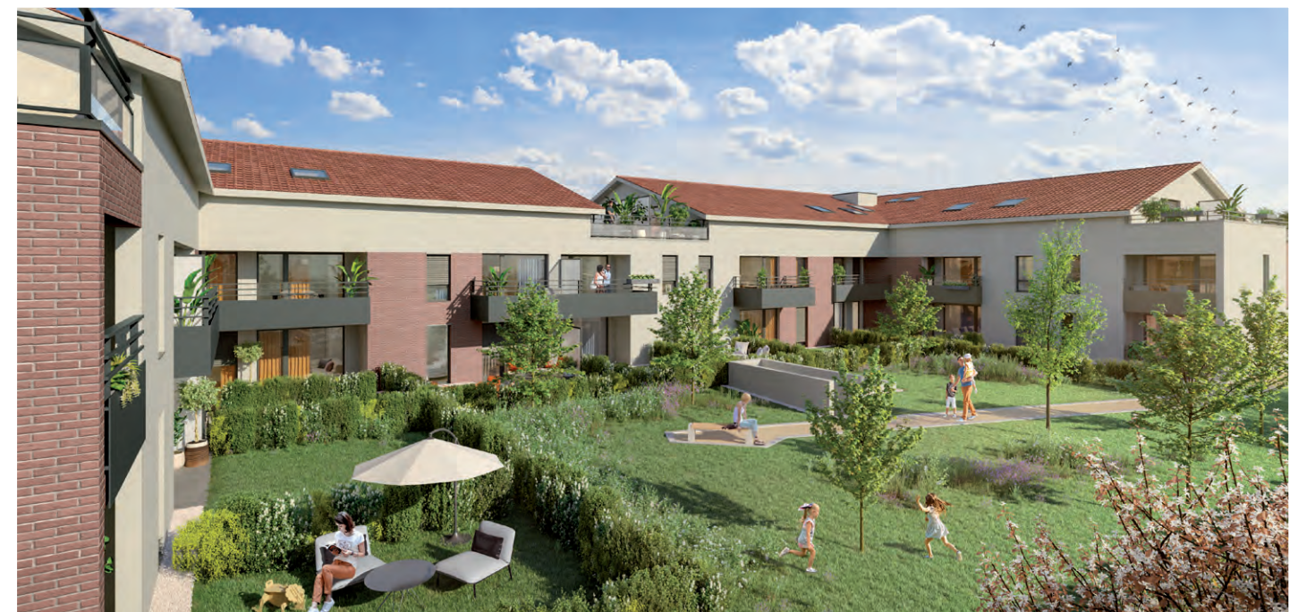
ILLUSTRATION À LA LIBRE INTERPRÉTATION DE L'ARTISTE - DOCUMENT NON CONTRACTUEL

L'Initiale propose des appartements déclinés du 2 au 4 pièces. La majeure partie des appartements bénéficie de belles expositions. Ils profitent également d'une loggia, d'un balcon, d'une terrasse ou d'un jardin privatif, dans le prolongement du séjour et sa cuisine ouverte. Pour davantage d'intimité, ces espaces extérieurs sont protégés par des jardinières, des haies végétales ou des pare-vues.