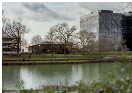
Parc d'Activités Enova Labège-Toulouse